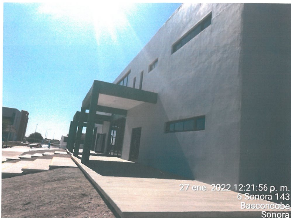
FACHADA PRINCIPAL DE EDIFICIO ACADÉMICO, COMEDOR-CAFETERIA, DE UNIVERSIDAD TECNOLÓGICO DE ETCHOJOA